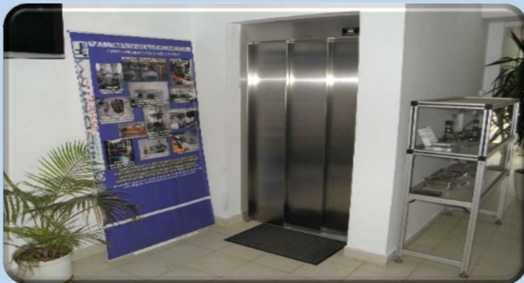
Lift care asigură transportul personalului si al echipamentelor spre locatia Camerei Curate.