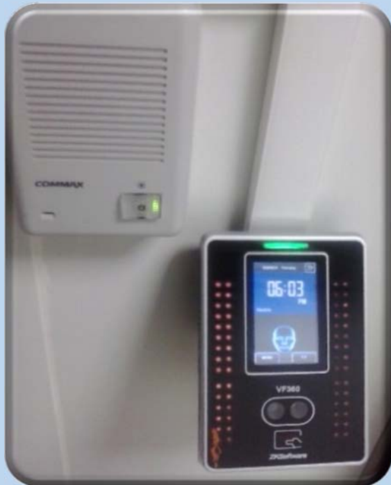
Sistemul de acces securizat controlat prin recunoastere facială, card securizat de acces, cod de acces.