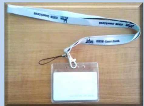
Card de acces in Camera Curata

Accesul operatorilor in CERTIM se face echipat special cu imbrăcăminte si incaltăminte adecvată condițiilor cerute de standardele in vigoare, minimizând contaminarea probelor si echipamentelor.