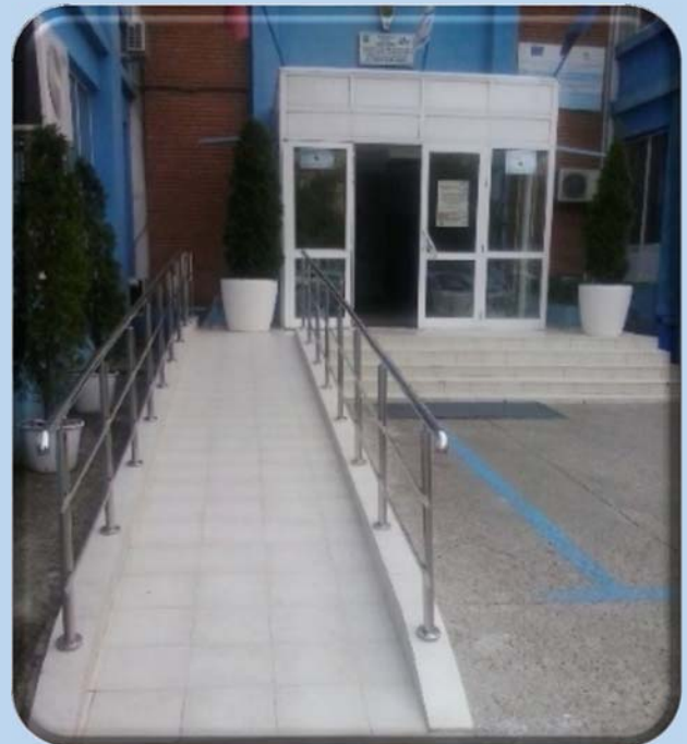
Rampă de acces la intrarea in sediul Institutului INCDMTM